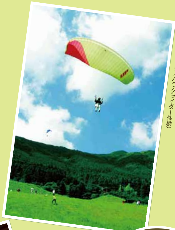
吾川スカイパーク (パラグライダー体験)