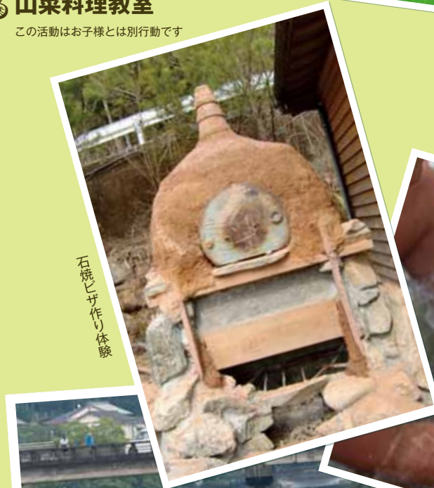
石窯ピザ作り体験