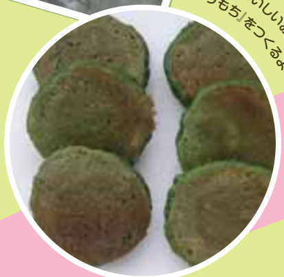
よもぎと小豆のたっぷり入った 地元のおいしいおやつ 「いりもち」をつくらよ!